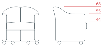
Poltroncina bassa su rotelle 1PS6011: L 68 P 60 H 68