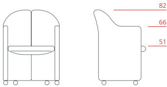
Poltroncina alta su rotelle 1PS6021: L 57 P 56 H 82